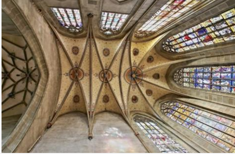
Blick in den Hochchor von Heilig Kreuz, Rottweil von Berthold Hildebrand besondere Ehre. Der Weihegottesdienst beginnt um 9:30 Uhr.