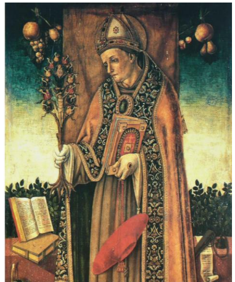
Photo: Image großen Franziskaner-Theologen. Er wird aufgrund seines Engagements in der

Am 15. Juli feiern wir den Gedenktag des heiligen Bonaventura (1221–1274), des