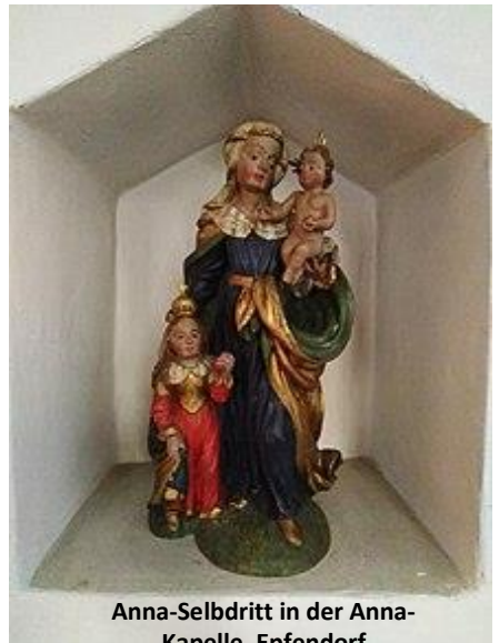
Anna-Selbdrift in der Anna-Kapelle, Epfendorf

einen Besuch abstellen und dort eine kleine Abendandacht feiern. Sie sind eingeladen! Die Kapelle ist im Privatbesitz und führt ihren Namen nicht auf die Mutter der hl. Gottesmutter Maria zurück, sondern hat ihren Namen durch die Stifterfamilie erhalten. Wir können jedoch davon